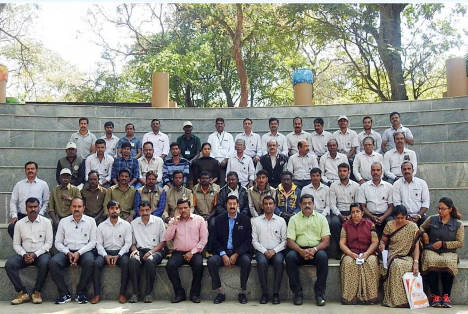
Group photo of the participants in the training program for Mahuts of Zoo Elephant

M ysore Zoo in collaboration with financial assistance from the Central Zoo Authority has organized training programme for second batch of Elephant Mahuts from southern zone zoo's from 4th-8th Feb 2019. It was well appreciated by the participant Mahuts.