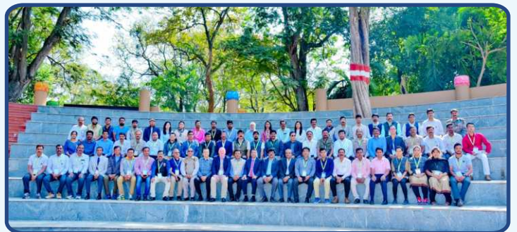
Resource persons addressing the participants