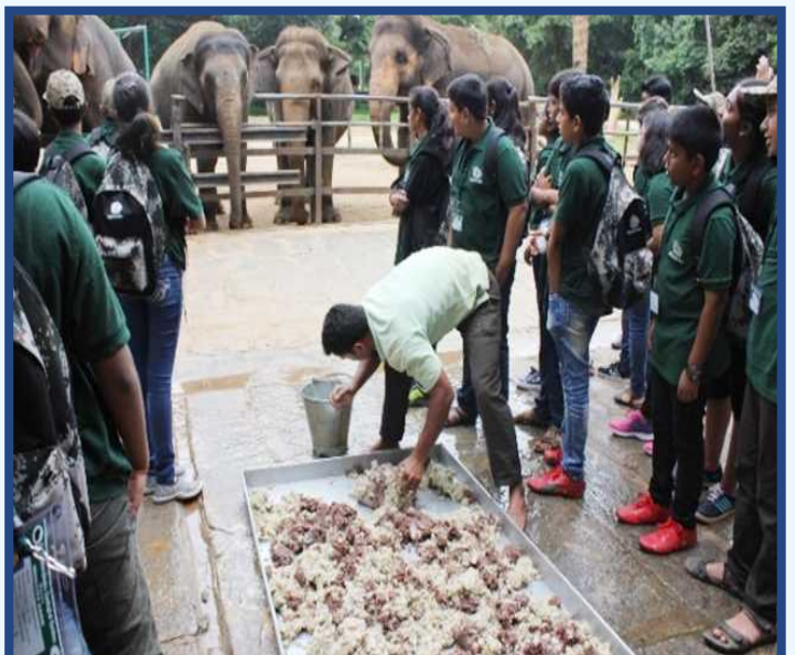
Glimpse of Youth Club